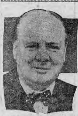
WINSTON CHURCHILL, primer lord del almirantazgo cuyo discurso de la semana anterior ha sido tan comentado

WASHINGTON, 29.—UP.— Oficiales navales de esta capital estiman que dentro de poco Alemania contará con una respetable flota de barcos de guerra de superficie, los que en conjunto con sus submarinos colocarán una nueva tensión sobre los aliados en la lucha por el dominio de los mares. De fuentes fidedignas se sabe que el Reich está construyendo cinco grandes acorazados de línea de 35 mil toneladas cada uno, dos portaviones de 20 mil toneladas cada uno, cinco cruceros blindados de 10 mil toneladas cada uno, un mínimo de cuatro cruceros protegidos de 7 mil toneladas cada uno, además de numerosos cazatorpederos, y otros barcos pequeños. La mayor parte de los barcos arriba mencionados, cuyas quillas fueron colocadas desde hace tres y cuatro años, se encuentran en un estado bastante avanzado, y por lo tanto se juzga que estas trescientas mil toneladas en barcos de superficie probablemente quedarán listas para entrar en acción, posiblemente en un momento en que