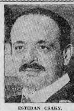
ESTEBAN CSAKY, premier húngaro cuyas declaraciones sobre la política exterior de su país en estos momentos reproducimos en otra sección.

Cortinas de fuego de la magnífica artillería fina impidieron en las cuatro intenciones que Helsinki fuera bombardeada por los aviones rusos.